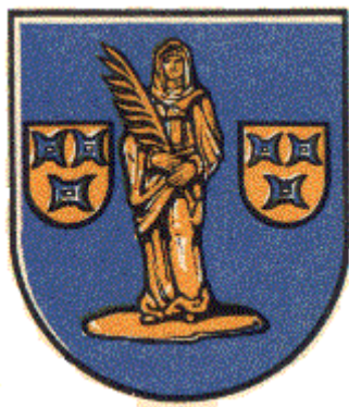
Wapen van Mierlo