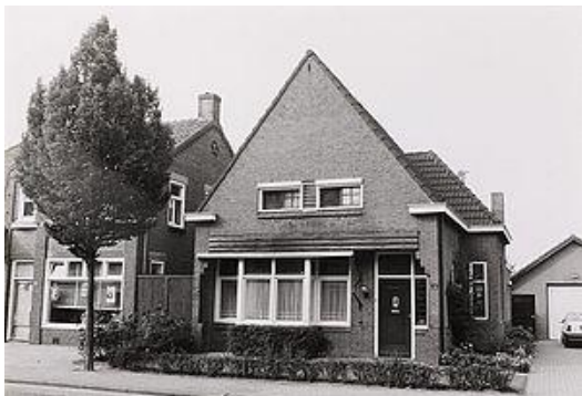
Brugstraat 13 Mierlo.