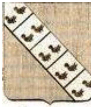
Wapen van de familie van der Maesen de Sombreff