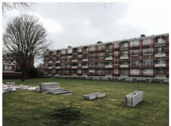
Foto: Enkele voorbeelden van ingrepen waarbij beschermde soorten kunnen worden aangetroffen.