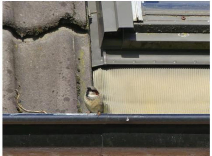
Foto: Huismus. Schuilmogelijkheden in de directe nabijheid van het nest zijn van cruciaal belang voor de instandhouding van de soort. Natuurinclusief bouwen gaat dan ook verder dan het aanbieden van geschikte verblijfplaatsen. De integrale benadering van het SMP in het planproces waarbij op basis van ecologische randvoorwaarden invulling wordt gegeven aan een stedenbouwkundig plan vergroot de effectiviteit van soortenbescherming.

De onderzoek frequentie van regulier ecologisch onderzoek is bedoeld voor een projectlocatie. Wordt een dergelijke frequentie toegepast op gebiedsniveau dan kunnen de kosten enorm oplopen. Het kan spannend zijn om de reguliere onderzoek frequentie los te laten. Het is dan ook van belang dat juristen, ecologen, de bouwsector en de woningbouwcorporaties hierover met elkaar in gesprek gaan.