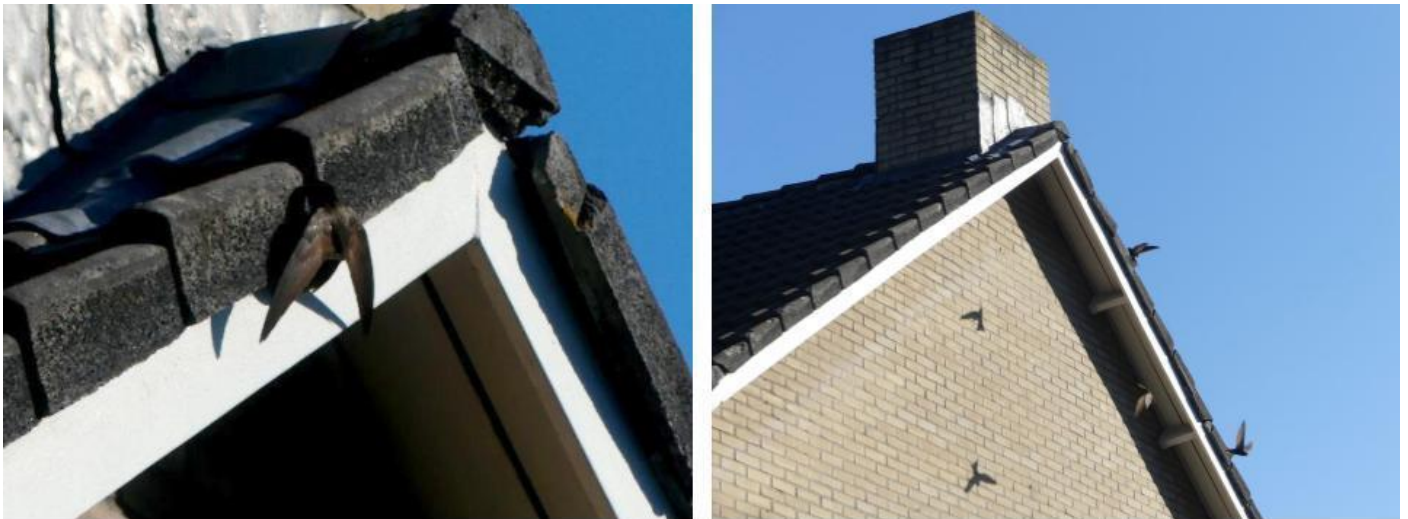
Foto: Nestplaats van een kolonie gierzwaluwen. Deze soort is voor het broeden afhankelijk van geschikte gebouwen.

Met het verduurzamen van woningen en renovatieprojecten neemt de bedreiging voor gebouw bewonende soorten toe. Nestplaatsen voor gierzwaluwen en huismussen en verblijfplaatsen voor vleermuizen verdwijnen. Bij aanwezigheid van deze verblijfplaatsen moet een ontheffing of verklaring van geen bedenkingen (vvgb) worden aangevraagd bij de provincie. De praktijk wijst uit dat ontheffingen vanwege de lange procedures niet altijd worden aangevraagd.