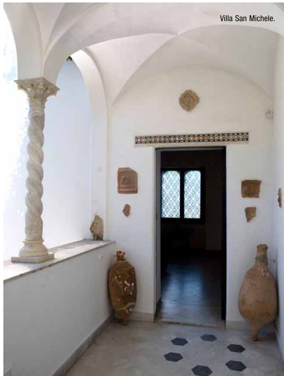
Villa San Michele.