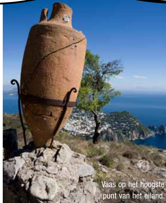
Vaas op het hoogste punt van het eiland.

In de jaren zestig namen schrijvers en filmsterren onder wie Sophia Loren, bezit van Capri. Nog steeds is het weelderige eiland een geliefde bestemming voor wie op zoek is naar rust, natuur en inspiratie.