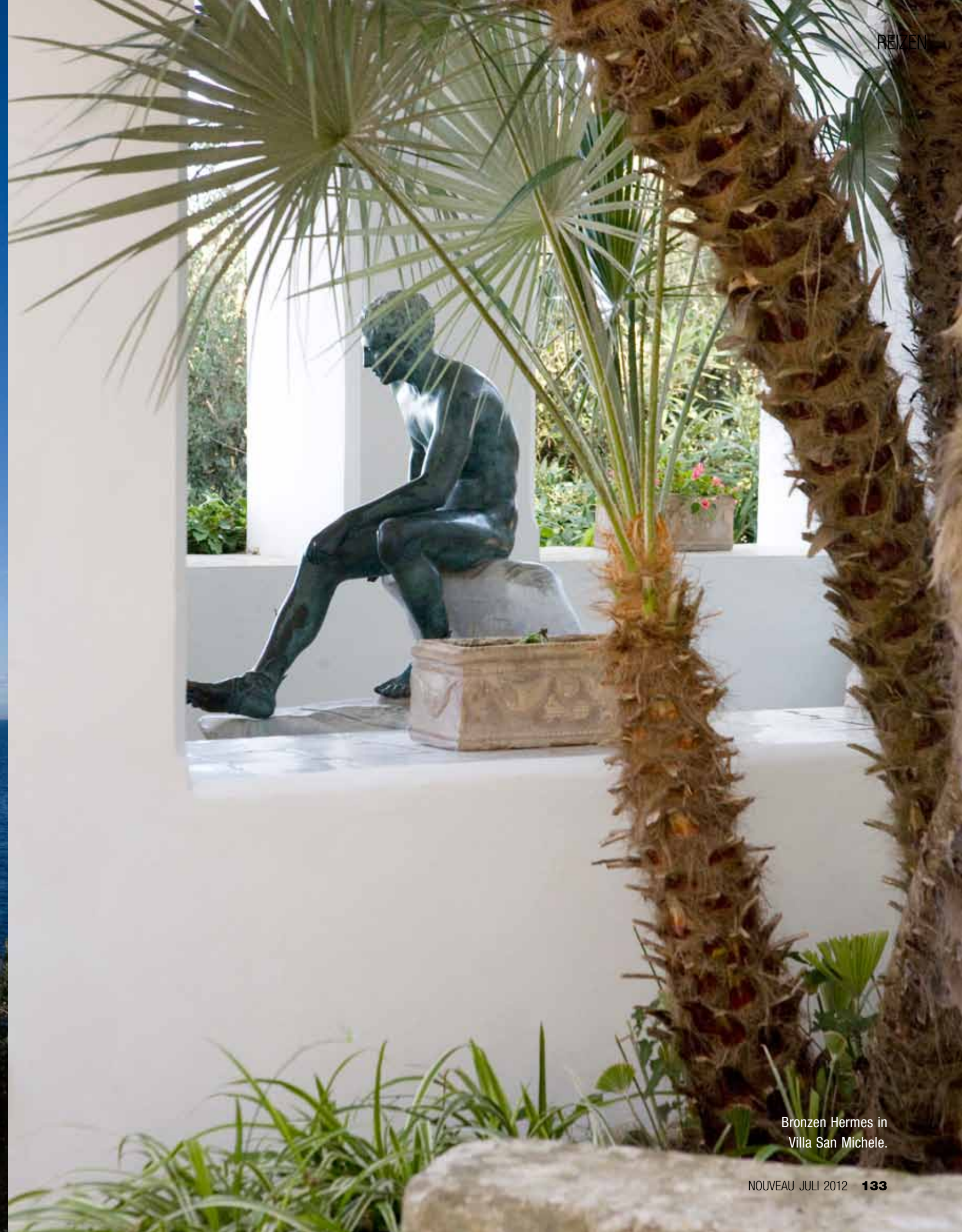
Bronzen Hermes in Villa San Michele.