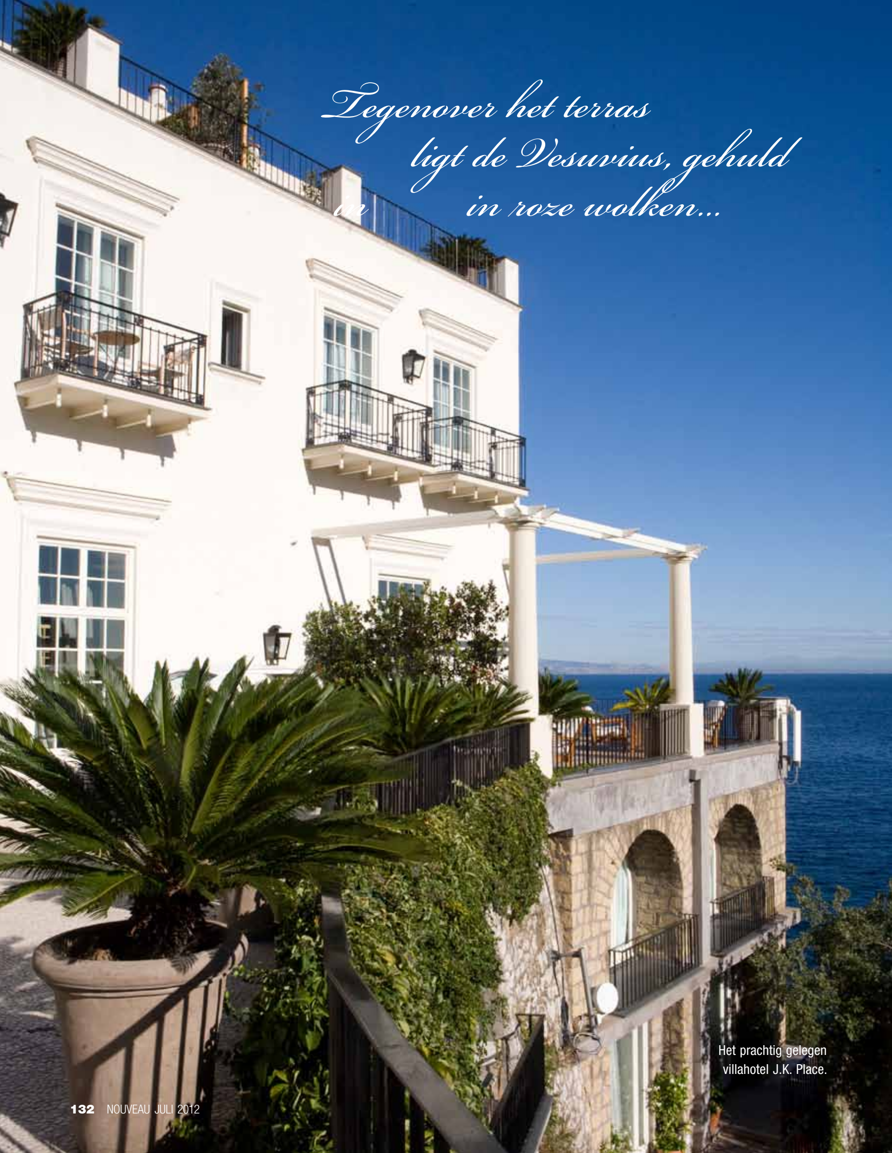
Het prachtig gelegen villahotel J.K. Place.