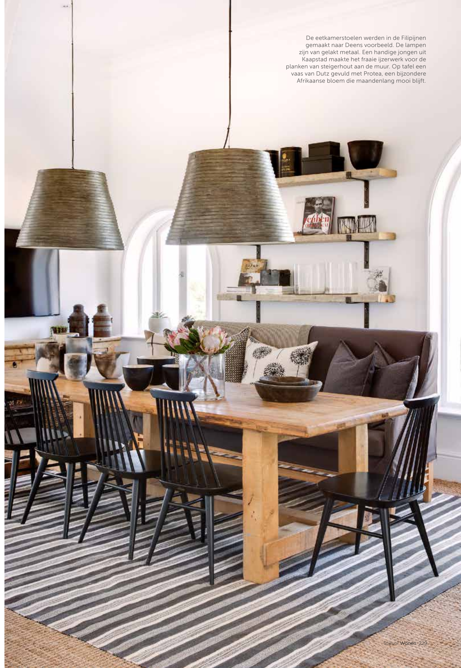
De eetkamerstoelen werden in de Filipijnen gemaakt naar Deens voorbeeld. De lampen zijn van gelakt metaal. Een handige jongen uit Kaapstad maakte het fraaie ijzerwerk voor de planken van steigerhout aan de muur. Op tafel een vaas van Dutz gevuld met Protea, een bijzondere Afrikaanse bloem die maandenlang mooi blijft.