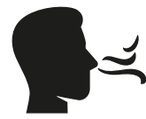
Reuk- en/of smaak- verlies

Heb je op dit moment een huisgenoot met milde klachten en koorts en/of benaauwdheid?