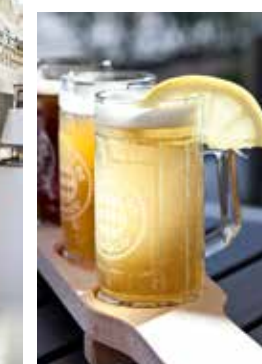
Pint bier bij Le Brasserie de Monaco.