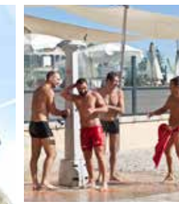
Verkoeling na het beach-volleyball.