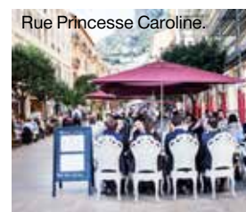
Rue Princesse Caroline.