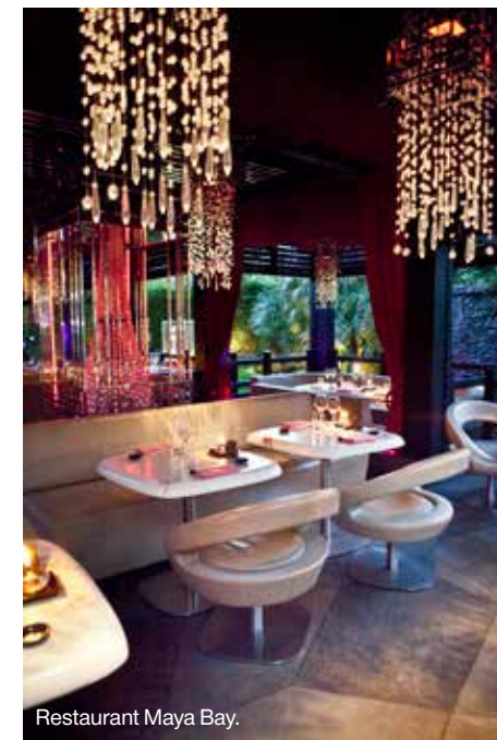
Restaurant Maya Bay.

Het museum in het historische pand The Temple of the Sea , geeft een fascinerende kijk op de onderwaterwereld. Avenue St-Martin, oceano.mc