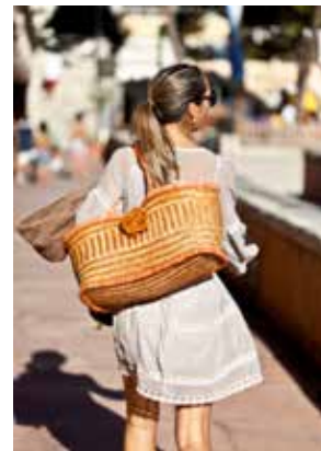
Shop till you drop.