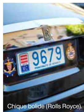
Chique bolide (Rolls Royce).