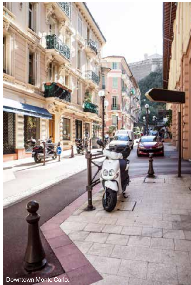
Downtown Monte Carlo.