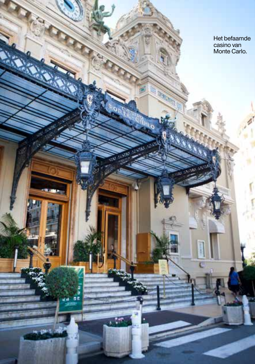
Het befaamde casino van Monte Carlo.