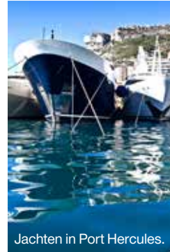
Jachten in Port Hercules.