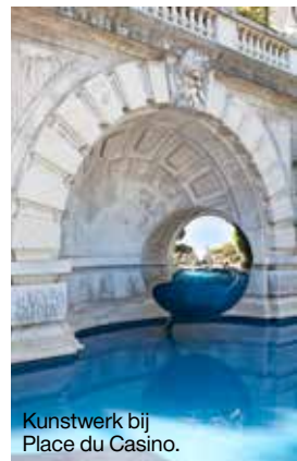
Kunstwerk bij Place du Casino.

Monaco wordt al eeuwen geregeerd door de Grimaldi's. De geschiedenis gaat terug tot 1297: François Grimaldi uit het Italiaanse Genua, bijgenaamd 'De Sluwe', wist