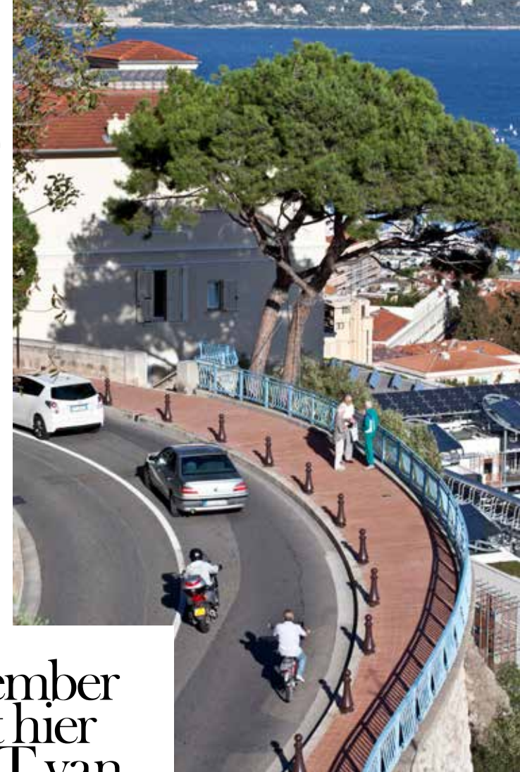
De bochtige straten van Monaco.

vermomd als monnik de rots te veroveren. De eerste aanzet tot de rijkdom van Monaco kwam met de opening van een casino in hoofdstad Monte Carlo in de tweede helft van de negentiende eeuw. Behalve het casino opende ook het prestigieuze Hôtel de Paris zijn deuren. Het bleek een gouden combinatie. Zowel het casino als het hotel hebben veel van hun aloude allure bewaard. In 1956 zette Hollywoodster Grace Kelly Monaco wereldwijd op de kaart, toen zij trouwde met prins Rainier. De tragische dood van prinses Gracia in 1982 vergrootte de mythe rond haar persoon.