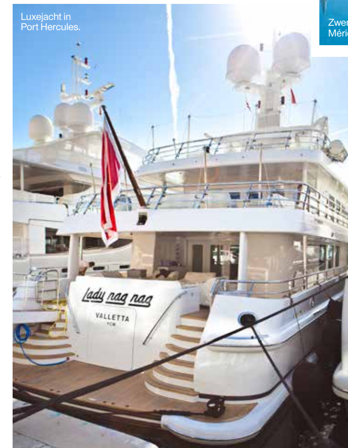
Luxejacht in Port Hercules.