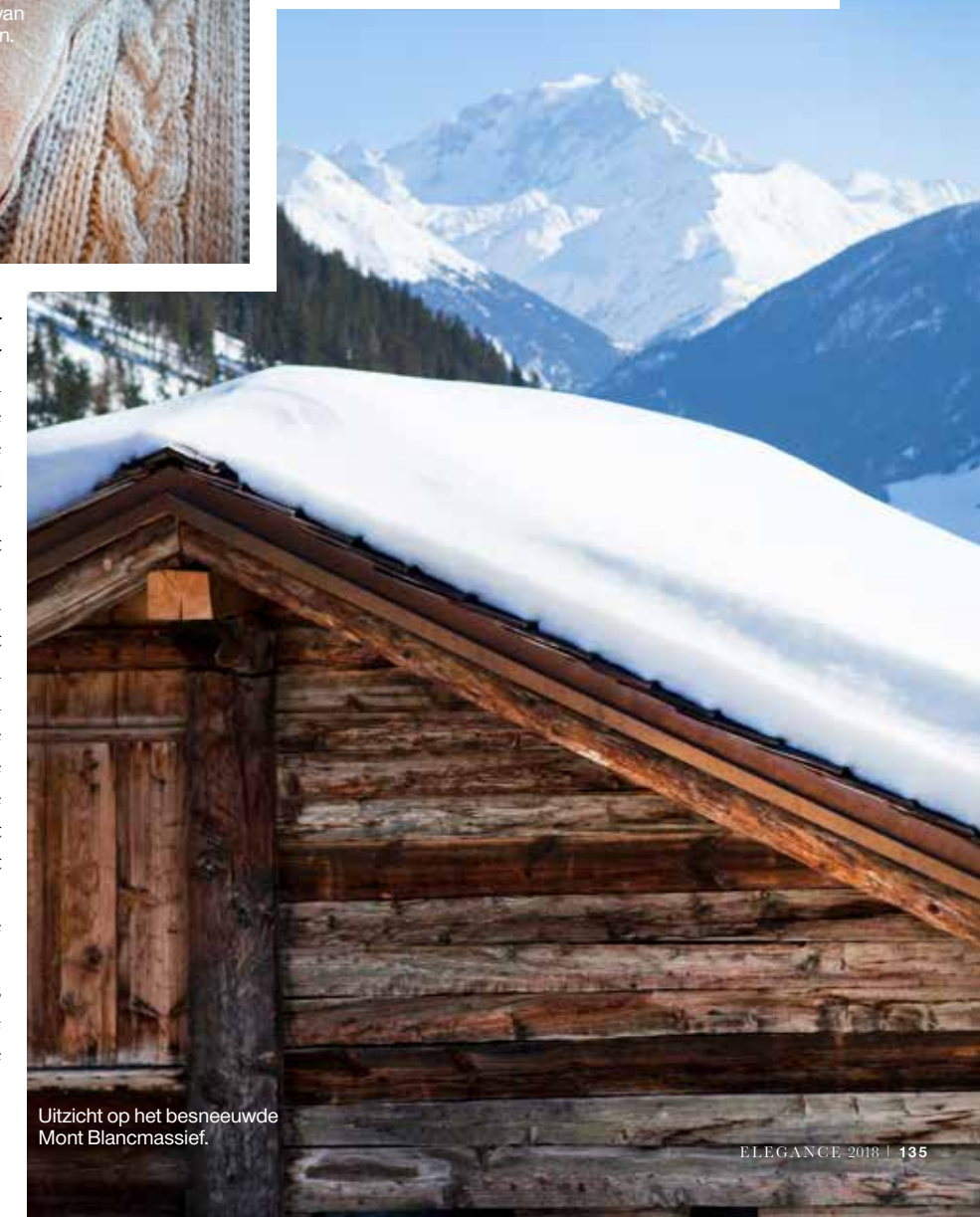
Uitzicht op het besneeuwde Mont Blancmassief.