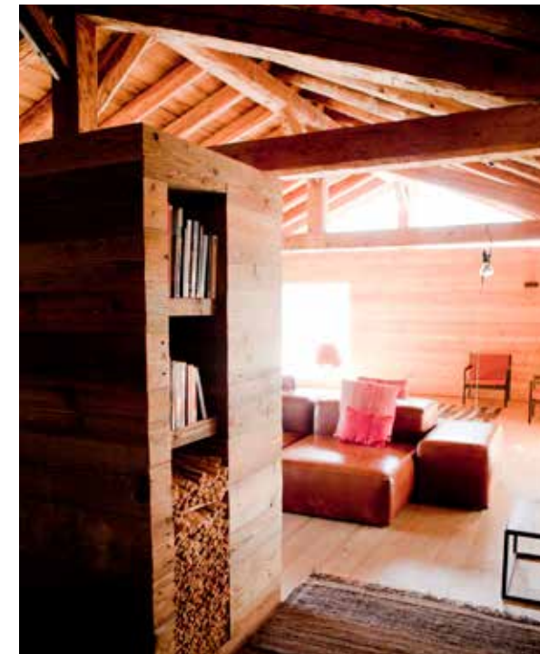
De gemeenschappelijke zitkamer met leren banken.

Montagne Alternative betekende de redding van het dorp. Steeds meer van de houten boerenhuisjes, waarvan het oudste uit 1700 dateert, wisten de beide