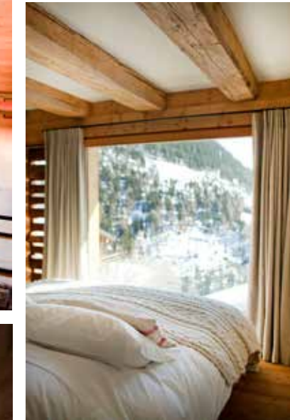
Beddengoed van pure materialen.