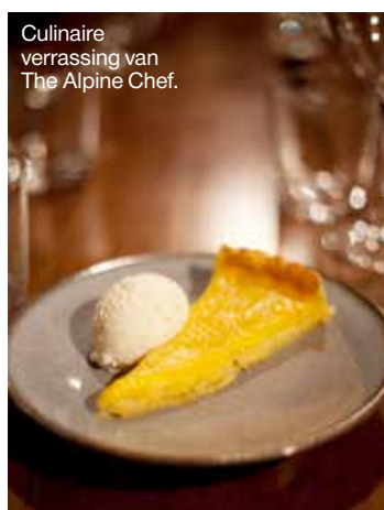
Culinaire verrassing van The Alpine Chef.

■ Nevaï Een ander stylish overnachtingsadres in hartje Verbier is het intieme boetiekhotel Nevaï met 35 kamers en de rustgevende Spa Elemis voor het ultieme zen-gevoel. Ga ook zeker in de bar een cocktail proeven, gemixt van 'vergeten smaken'. hotelnevai.com