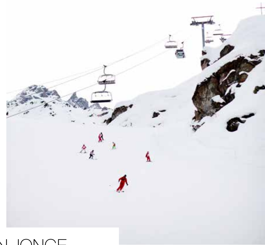
Skipiste in Verbier.

Nu we toch in deze contreien zijn, gaan we een dagje naar het stadje Martigny voor een bezoek aan de sint-bernardshonden. We zijn immers in de Pays du Saint-Bernard, de streek waar de dieren oorspronkelijk vandaan komen. Er is in Martigny een kennel en speelweide voor de honden. Zodra we de wei in lopen, dartelen er tientallen puppy's om ons heen en zijn we compleet vertederd. Een van de jonge honden begint schattig te kauwen op de veters van mijn snowboots. Over de hele wereld zijn er sint-bernards, maar hier treffen we het oorspronkelijke ras. Af en toe worden de honden gemixt met een andere sint-bernard voor vers bloed. De puppy's zijn nu acht weken oud. Over een week of twee worden ze verkocht aan zorgvuldig geselecteerde particulieren, laten we ons vertellen. We maken kennis met twee grotere honden, Ranna en Kathy. Ze poseren gewillig en laten zich graag aaien. Sint-bernards worden inmiddels niet meer ingezet om mensen te redden. Dat gaat tegenwoordig met helikopters en 'lichtere' honden. Wel worden deze lobbjes op andere manieren ingezet, om kinderen te leren voor dieren te zorgen bijvoorbeeld.