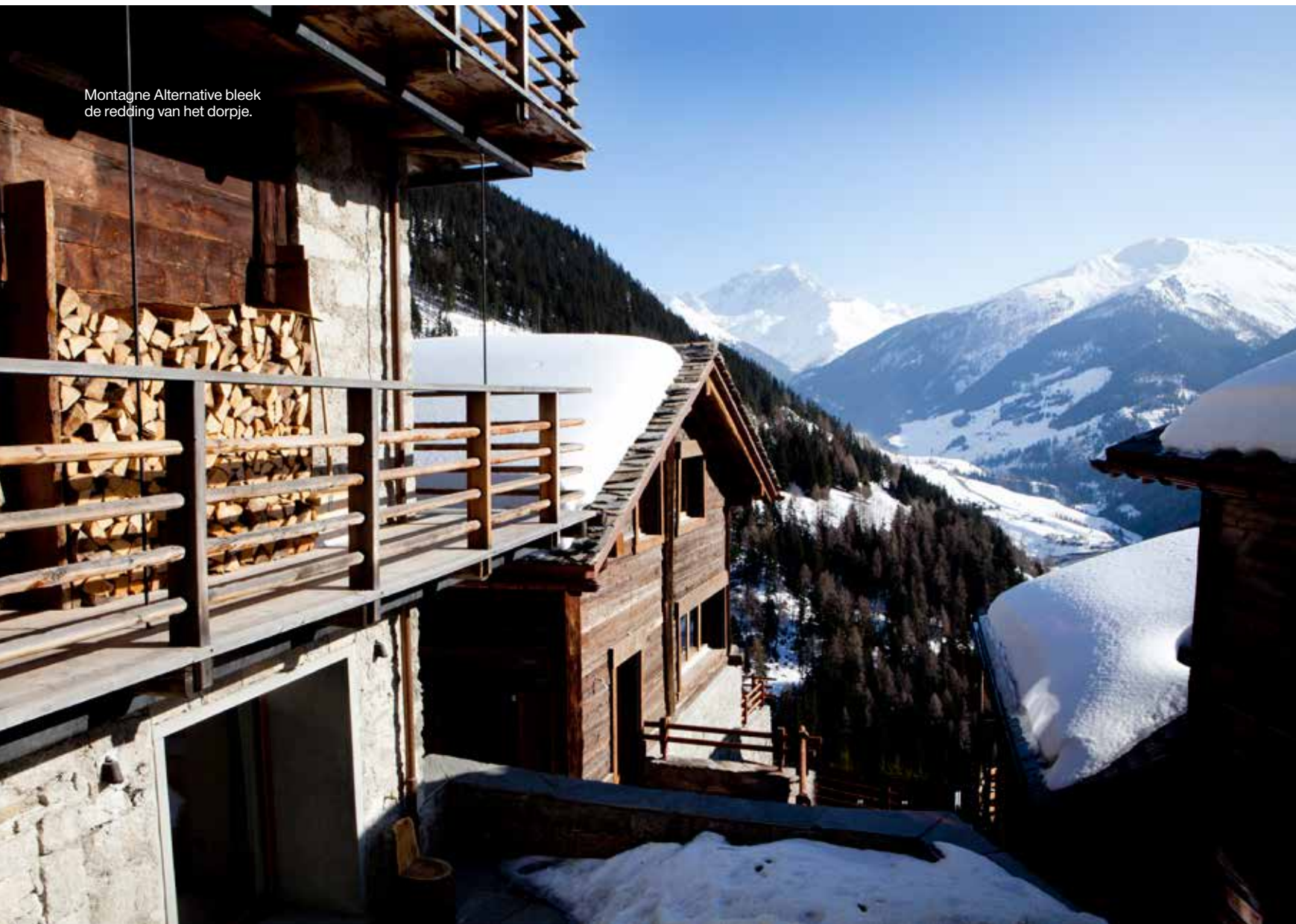
Montagne Alternative bleek de redding van het dorpje.

contact komt met jezelf en met de natuur. De locatie leent zich voor overpeinzingen én voor actie. Bedrijven komen hiernaartoe voor teambuilding. Ze gaan met hun werknemers de berg op en drinken een borrel in de natuur', vertelt een van de medewerkers. 'De smartphones gaan uit en mensen zijn verbaasd over de rust die ze dan ervaren. Alle seizoenen zijn betoverend mooi. Er is 280 dagen per jaar zon en vooral in mei en juni zijn de bergen intens groen.'