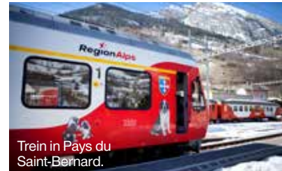
Trein in Pays du Saint-Bernard.

■ Boutique Ogier Toonaangevend Frans modemerkt uit 1948. Skimode en accessoires. Kwaliteit staat er hoog in het vaandel. Rue de la Poste 8, Verbier, ogier-og.com