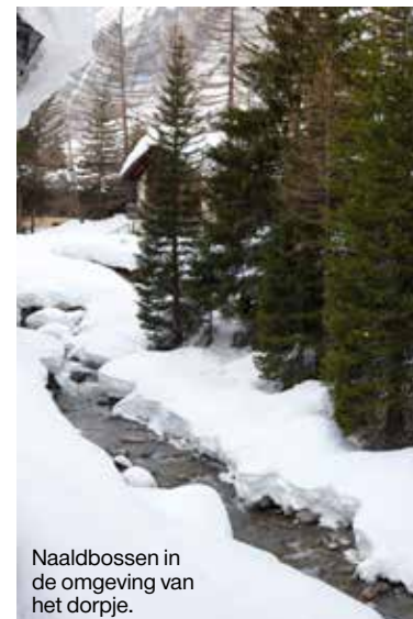
Naaldbossen in de omgeving van het dorpje.