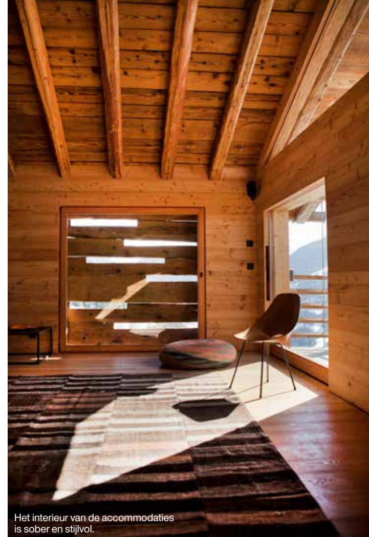
Het interieur van de accommodaties is sober en stijlvol.

alle rust en vrijheid in het Zwitserse oord. Met behulp van onder anderen zijn neef Benoît knapte hij een paar van de vele leegstaande boerderijtjes op. Oorspronkelijk bewoonden zo'n zeven grote boerenfamilies het complete dorp. Er waren koeien en de melkproductie leverde een inkomen op. Ook maakten ze hun eigen marmelade en verbouwden ze wijn. Maar de jeugd trok weg en steeds meer huizen kwamen leeg te staan. Uiteindelijk waren er nog maar twaalf inwoners over.