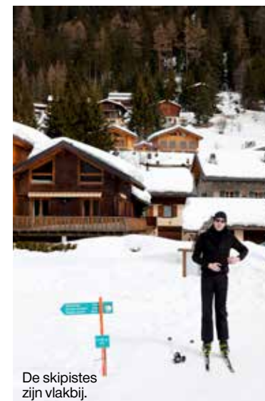
De skipistes zijn vlakbij.