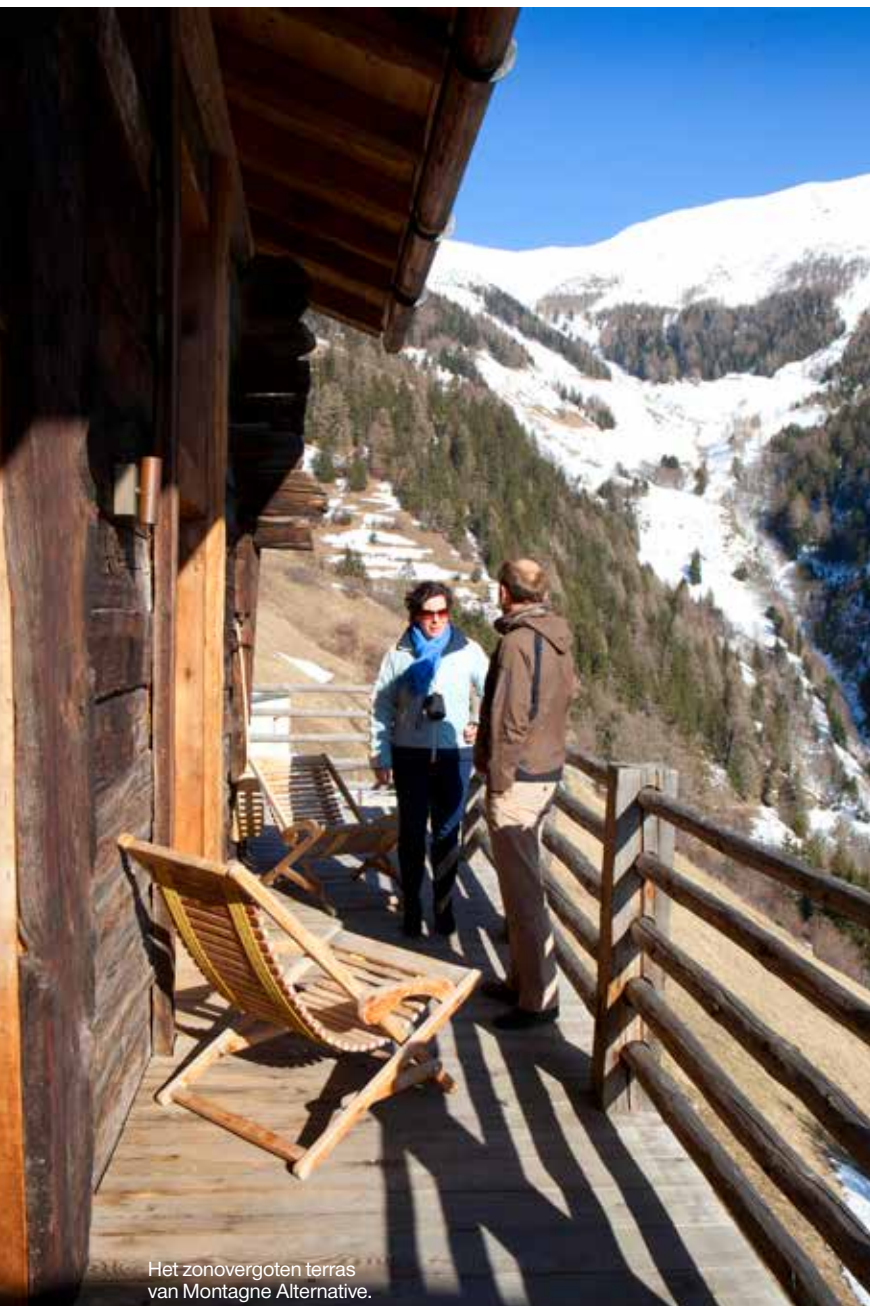
Het zonovergoten terras van Montagne Alternative.