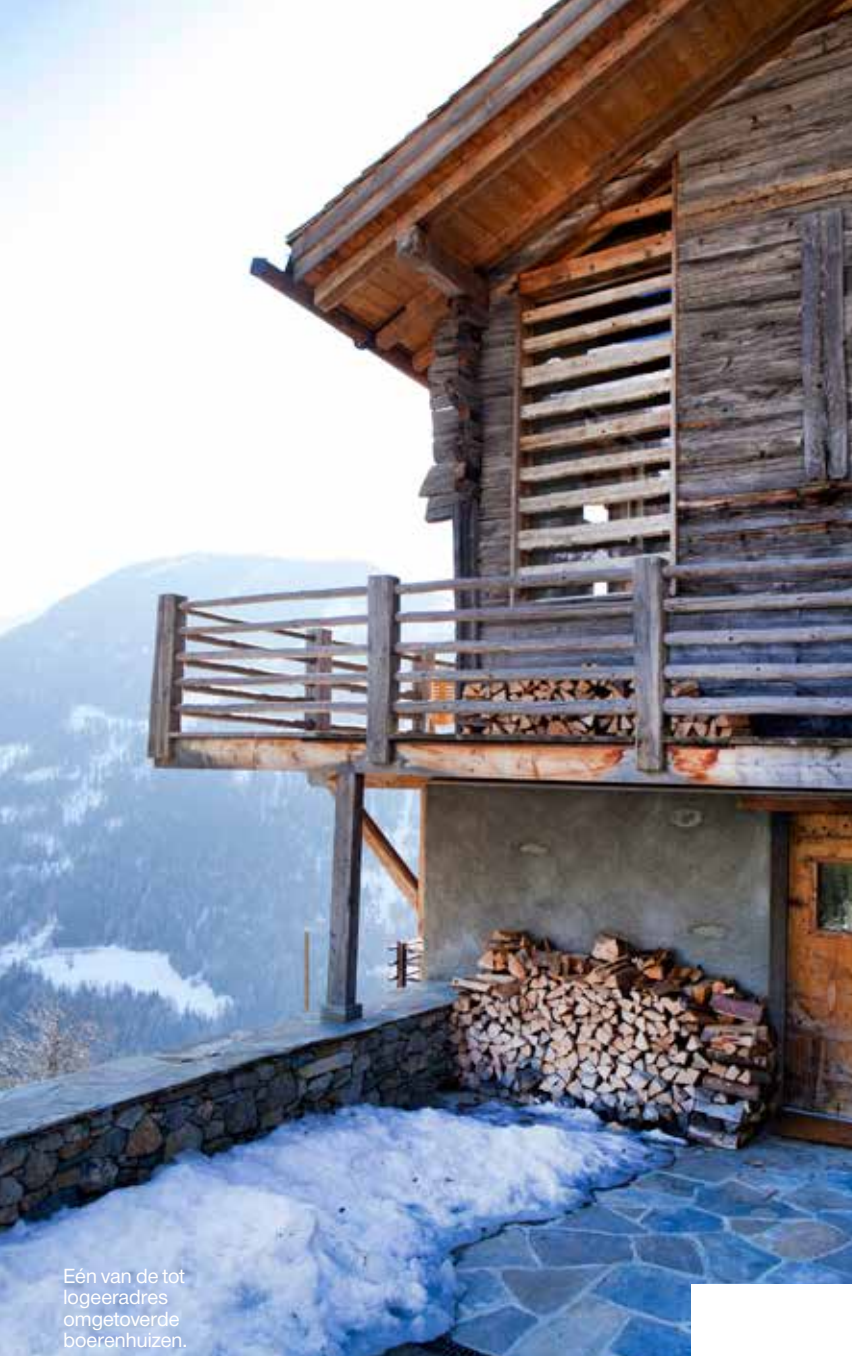
Eén van de tot logeeraadres omgetoverde boerenhuizen.