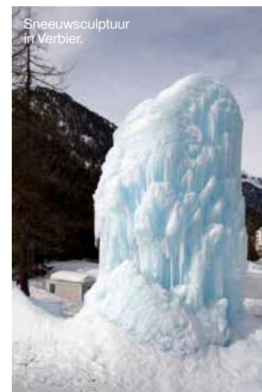
Sneeuwsculptuur in Verbier.

Het huis waar wij logeren blijkt één van de grootste te zijn. Het waren oorspronkelijk dan ook twee 'schuren' naast elkaar. Het souterrain, waar onze slaapkamers zich bevinden, was ooit de koeienstal met daarboven de hooizolder... De zitkamer en keuken delen we met andere