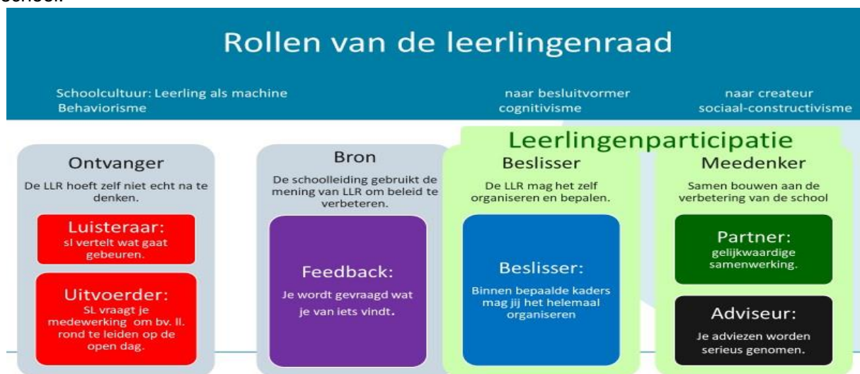
Figuur 1: Rollen van de leerlingenraad. Manders, 2019.

Het model beschrijft vier voor leerlingen en schoolleidingen herkenbare hoofdrollen. Het vooraf bepalen van de rol die de leerlingenraad heeft op een bepaald schooldomein maakt helder wat van wie verwacht wordt. Welke rol het beste gekozen kan worden is afhankelijk van de drie factoren participatiedomein, de ontwikkeling in tijd en van de overheersende cultuur op een school.